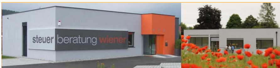
Unsere neue Adresse: bundesstraße 42, 8160 weiz-preding

Wir freuen uns sehr auf die Arbeit für unsere Kunden im neuen Haus, einige Fotos sollen Ihnen zeigen, wie unsere neue Wirkungsstätte aussieht. Wir hoffen auf einen baldigen Besuch, ein Eröffnungsfest wird es im Herbst geben.