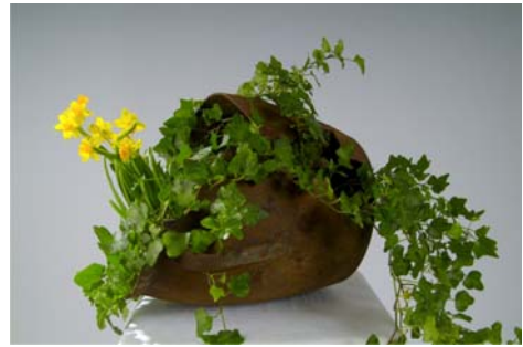
Blumen, die aus Zwiebeln wachsen, werden in China als Glückspflanze angesehen. Besonders Narzissen symbolisieren eine verschwenderische Fülle, die sich aus Unsichtbarem entwickelt. Wie vergrabenes Gold wartet sie darauf, unter Mithilfe von Sonne, Wärme und Nahrung verborgene Talente an den Tag und versteckte Fähigkeiten zur Entfaltung zu bringen.

es eine Sehnsucht nach Veränderung und Erfüllung im Leben oder in wichtigen Beziehungen gibt.